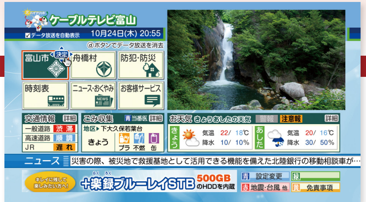
データ放送トップ画面例